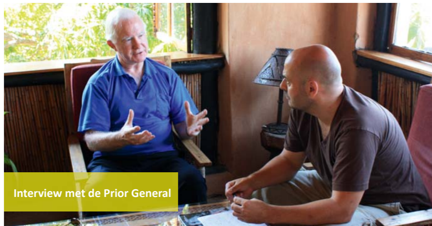
Interview met de Prior General

"Minder Broeders is geen enkel probleem! De instroom van gekwalificeerd lekenpersoneel zorgt juist voor groei. Jonge Afrikaanse mannen en vrouwen die van de universiteit komen of van onze eigen verplegersopleiding, willen