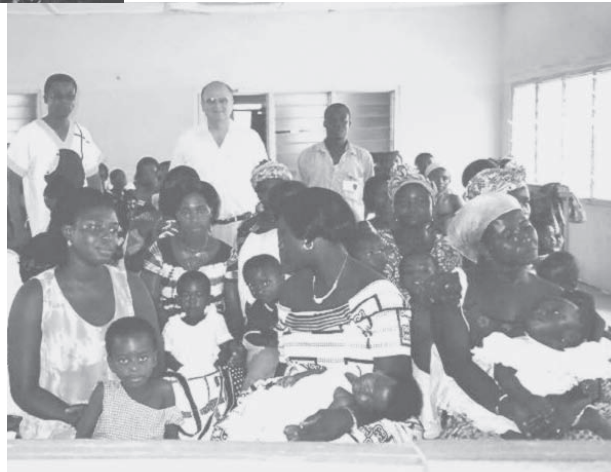
Asafo, jonge moeders in het Nutricia Centre